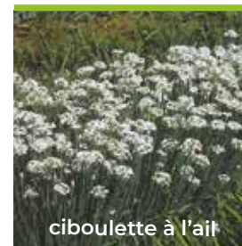
ciboulette à l'ail

Vous préférez cultiver à petite échelle? Choisissez un petit jardin urbain ( smart pot ), qui inclut trois plants distincts.