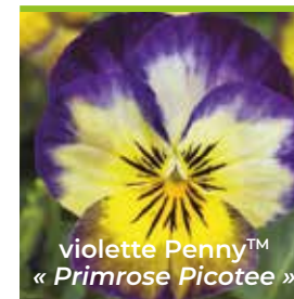
violette Penny™ « Primrose Picotee »